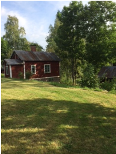
Lillstugan vid torpet