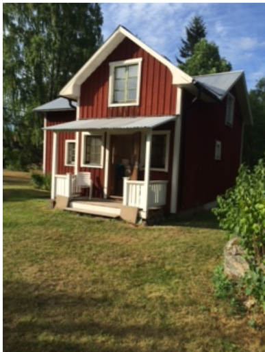
Torpet på framsidan

140720 : Dalhalla och Björn Skifs. En helt fantastisk kväll.