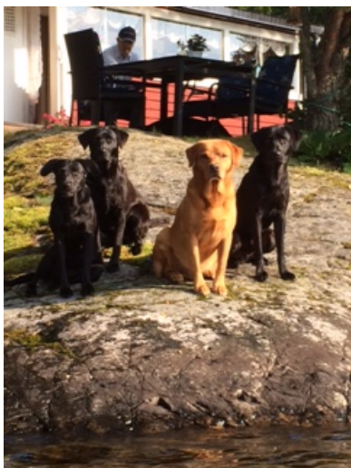
Axa, Gynet, Wirre & Singha och morfar