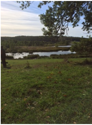
Härliga marker på A provet