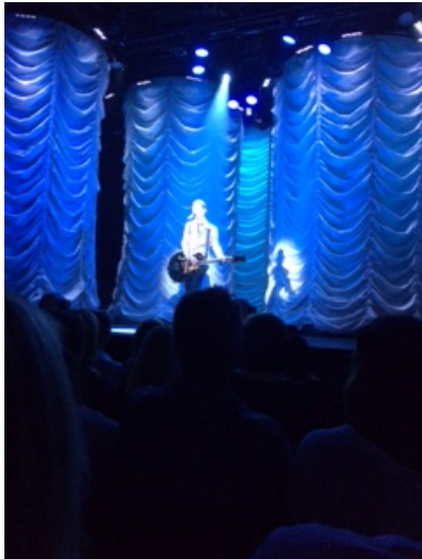
Orup på Hamburger Börs 141004