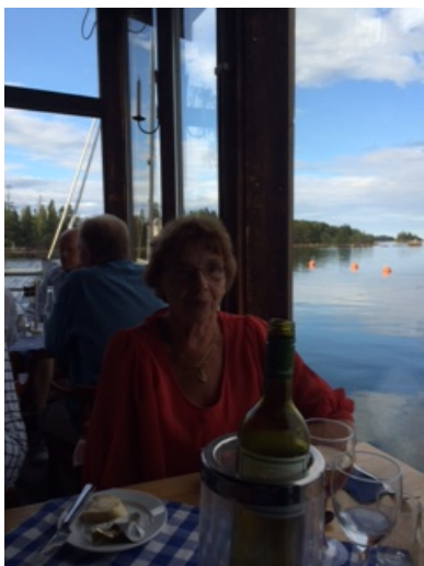
Grattis mamma på 80 års dagen.