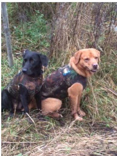
Axa & Wirre 141025