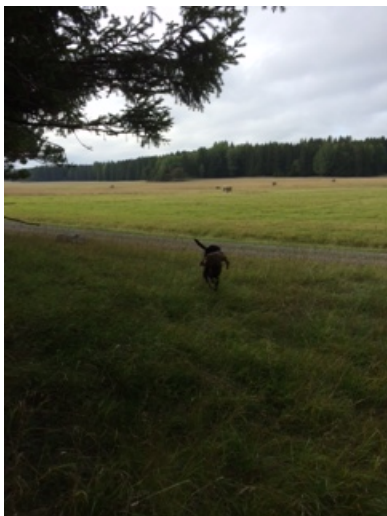
Singha kommer med and