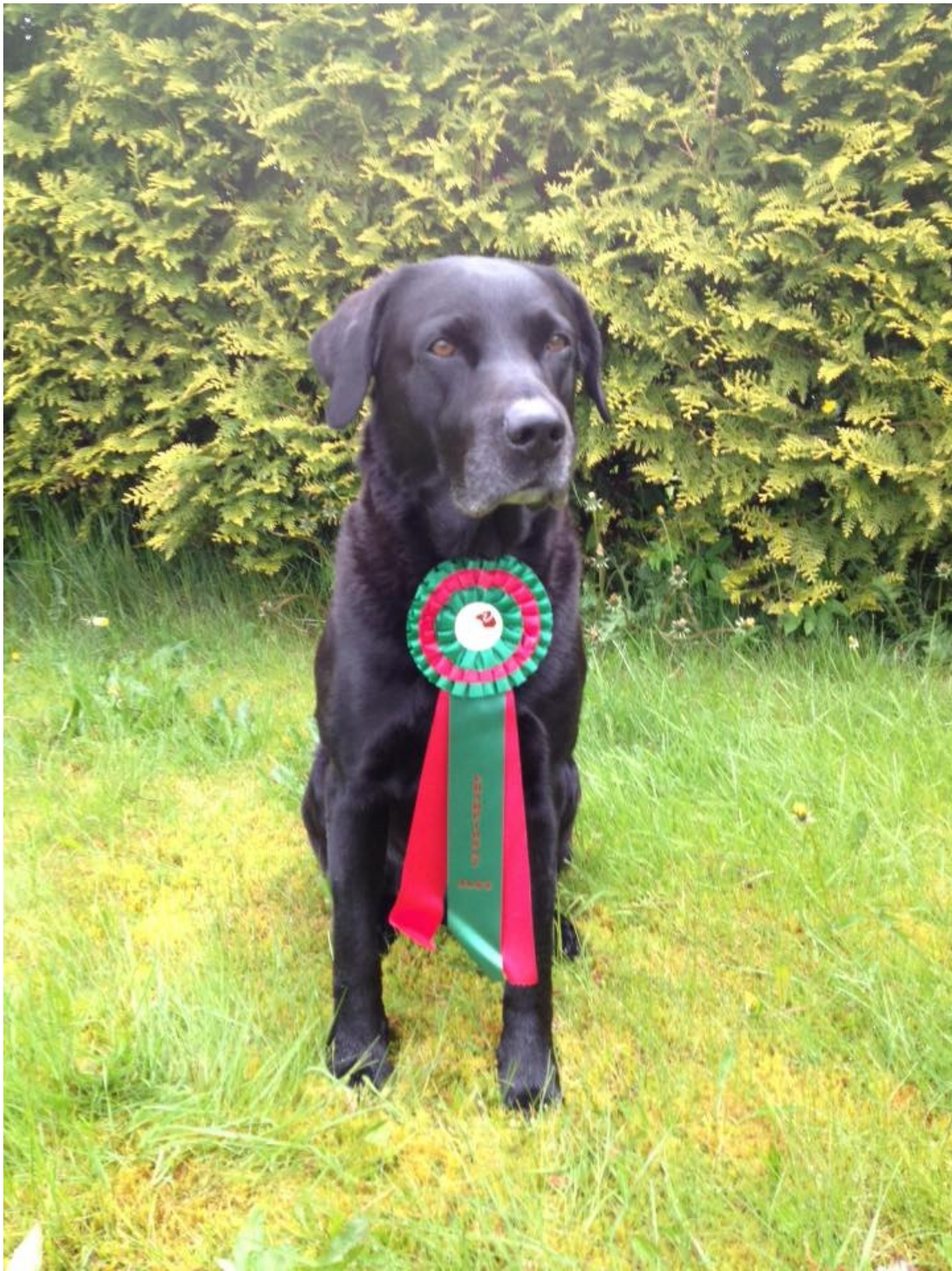
GRATTIS ALVAS G KULL PÅ 9 årsdagen 150524