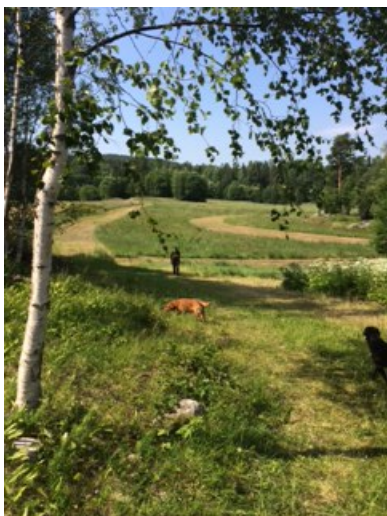
Träning på Innergården. Hälsingland.