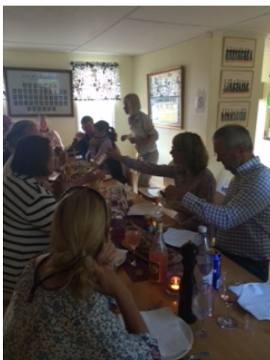
Skål & trevlig midsommar

140615 : Kratten nästan hela helgen. Fredag kväll justerat upplägg för ÖKL & EKL. En fin kväll med massor av mygg och knott mot slutet av kvällen. Ja, det blev en helkväll i Kratten.